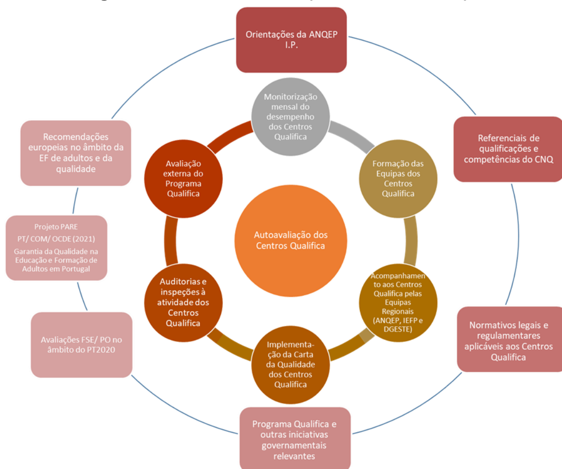
Figura 1. Modelo de Garantia da Qualidade dos Centros Qualifica

A FIGURA 1 mostra o modelo de garantia da qualidade dos Centros Qualifica definido pela ANQEP no âmbito das suas atribuições no SNQ e para efeitos de gestão e implementação do Programa Qualifica.